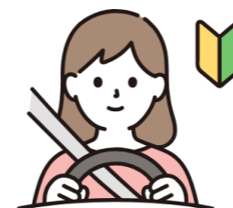
社会福祉学部 新2年生 女性